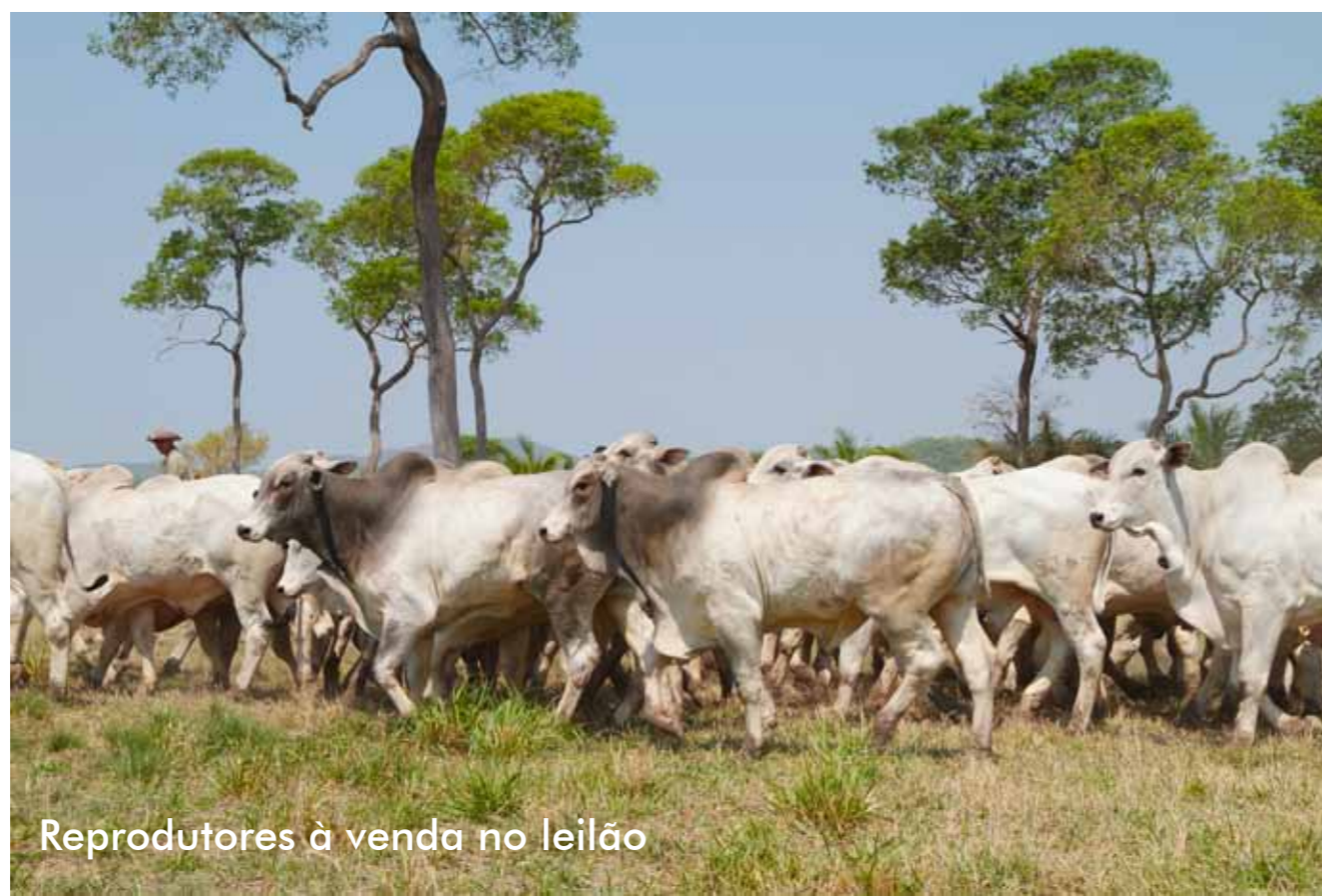
Reprodutores à venda no leilão

Informativo - Fazenda Bodoquena Edição Especial