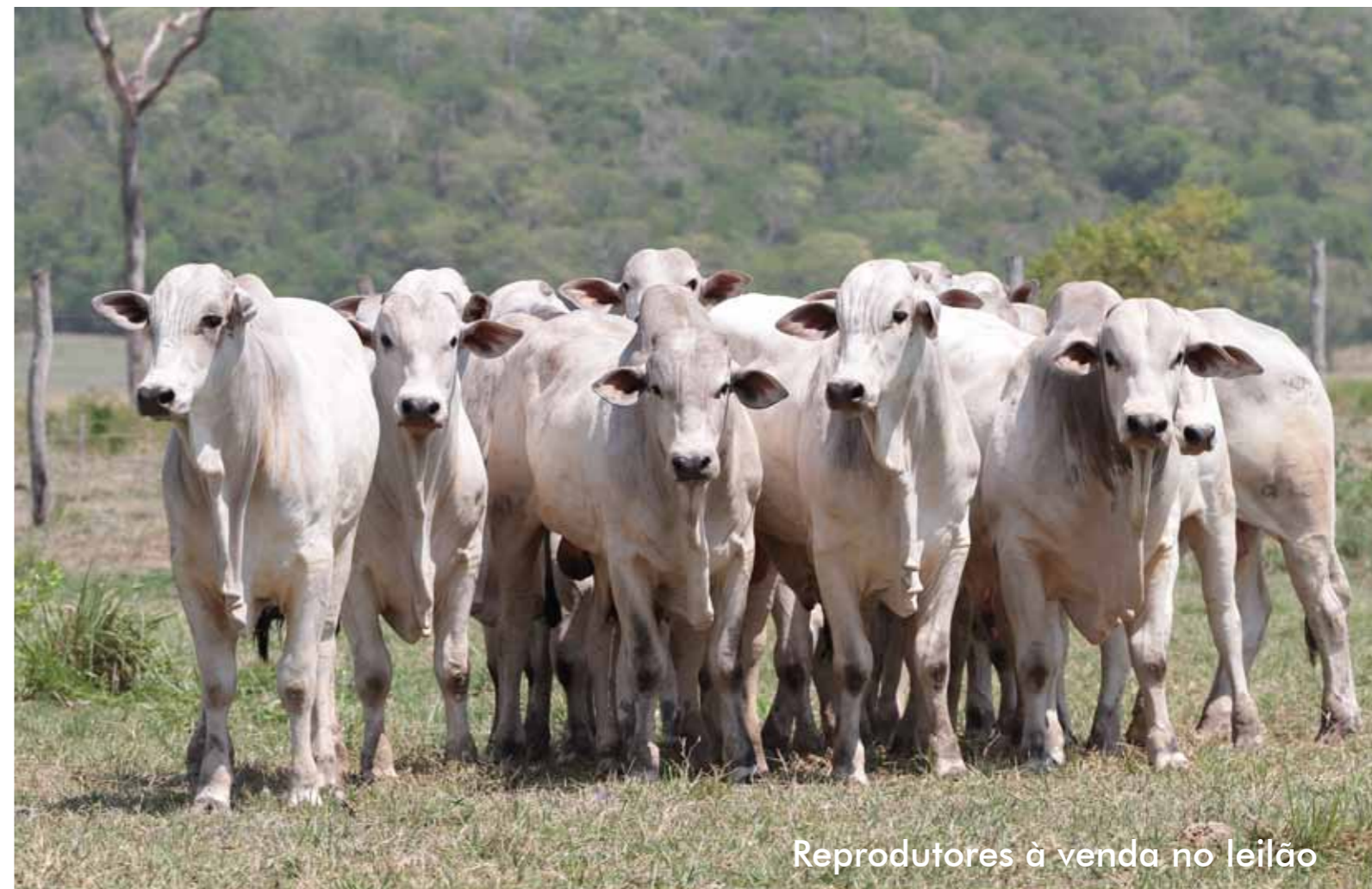
Reprodutores à venda no leilão

A partir de 1950, após ser adquirida por novos acionistas, a